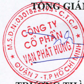
TRƯƠNG THÀNH NHÂN